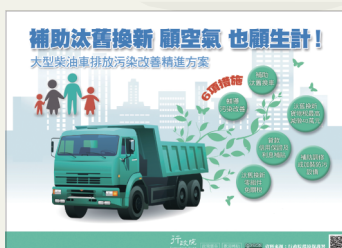
大型柴油車排放污染改善精進方案