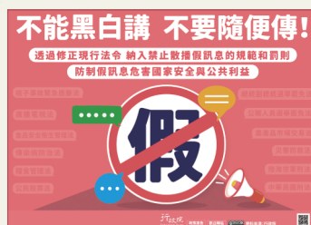
不能黑白講，不要隨便傳！