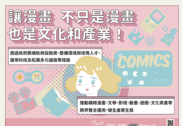
讓漫畫，不只是漫畫 也是文化和產業！