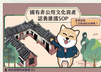
國有非公用土地文化資產認養維護