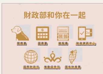
財政部和你在在一起