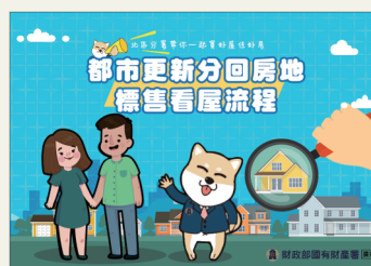
都更分回房地標售及帶看屋服務