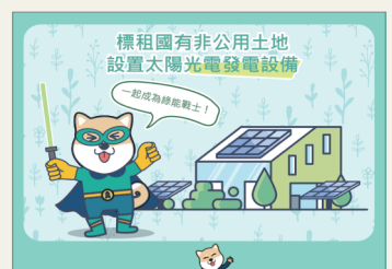
標租國有非公用土地 供設置太陽光電發電設備