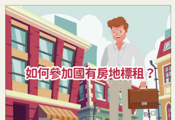
如何參加國有房地標租