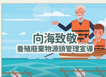
向海致敬 - 養殖廢棄物源頭管理宣導