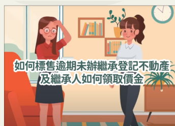
如何標售逾期未辦繼承登記不動產及繼承人如何領取價金