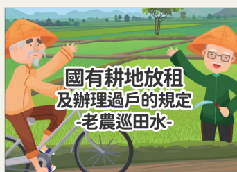
國有耕地放租及辦理過戶的規定